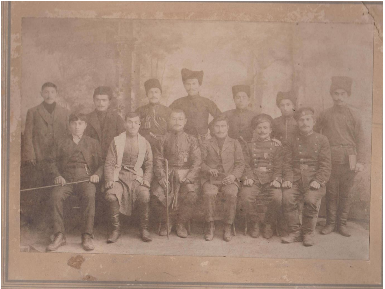
Жители с. Эдиссия, 2014год.