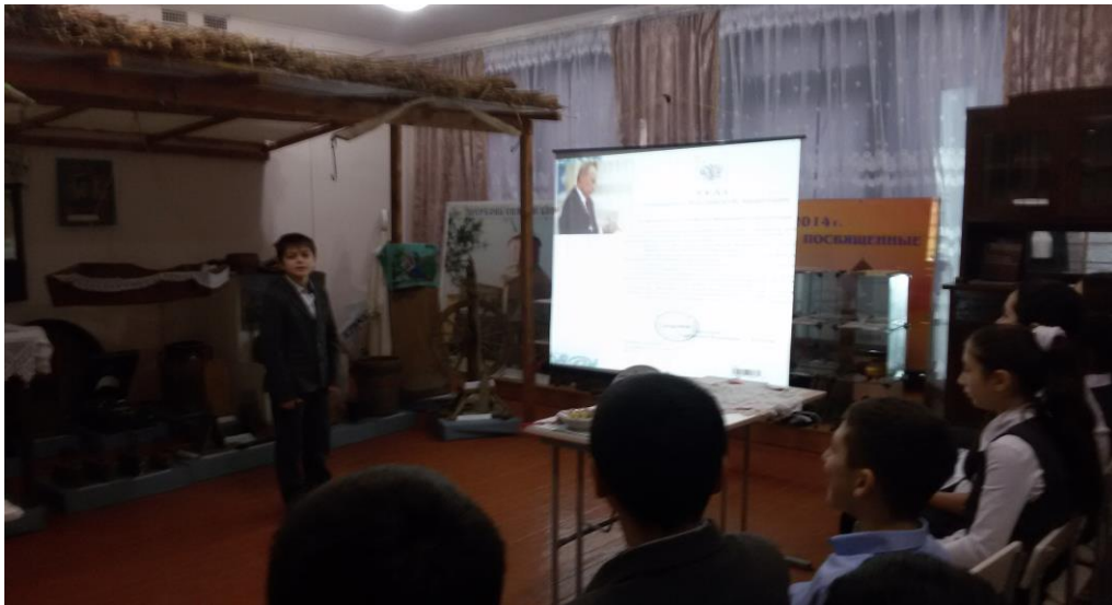
Урок в музее «Этнографии»